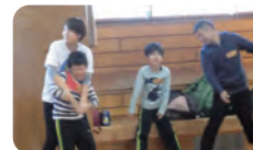
クリスマス運動会